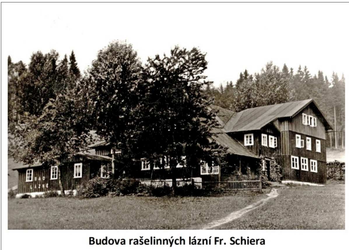
Budova rašelinných lázní Fr. Schiera

lázeňský dům se 47 pokoji a 18 vanami. Mnoho turistů z Harrachova sem za lázeňskými kúrami docházelo.