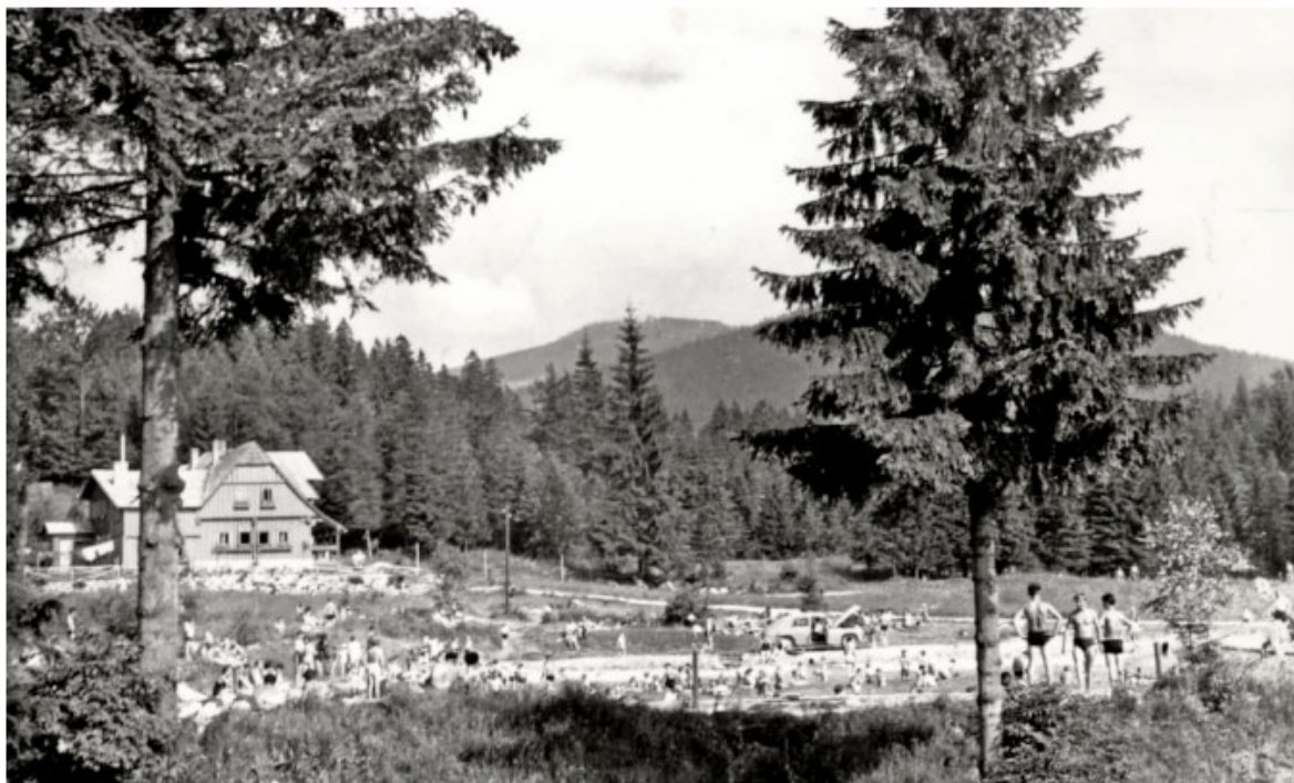
V polovině 50. let bylo koupaliště hojně navštěvováno. V pozadí bývalá budova lázní.

provozuje dodnes. Dochází k rozšíření zázemí, vybudování občerstvení a společenské místnosti. Budova je postavena z dřevěných panelů bývalé horské chaty Výrovka. Vedle koupaliště je k dispozici minigolf. V areálu, jehož součástí je i ubytovací zařízení, bývalá budova lázní, se pořádají různé kulturní a sportovní akce.