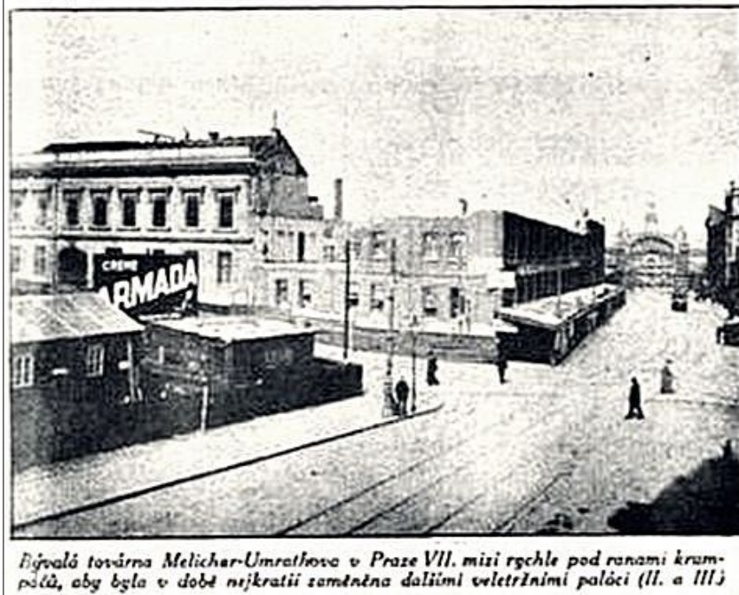
Děvalá továrna Melichar-Umrathova v Praze VII. mízí rychle pod ranami krum-pálů, aby byla v době nejkratší zaměněna dalšími veletržními paláci (II. a III.)