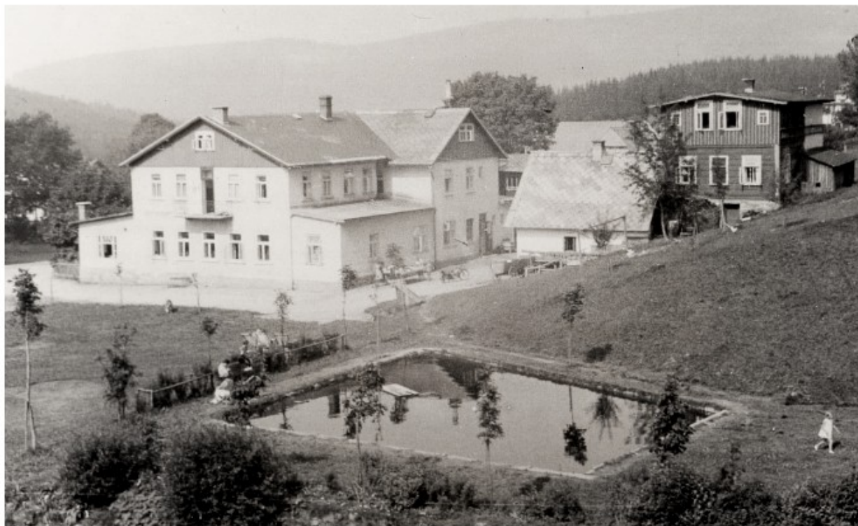
Koupaliště u Ducha hor

koupaliště, obojí s předeřhřivanou vodou, budova s více než 50 šatnami, restaurace s terasou, sprchy samostatné i hromadné, pláže písčné i travnaté a lázně. K realizaci tohoto areálu o rozloze více než dva hektary již bohužel kvůli 2. světové válce nedošlo.