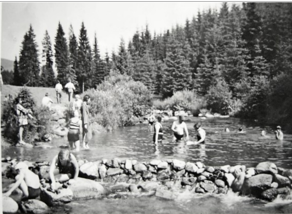
Děti na Mumlavě v Anenském údolí ve 20. letech minulého století