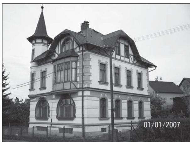
Kloučkova vila 2007

Stylový a ve své době velmi moderní rodinný dům podobný zámečku, jenž se do ulice dívá atypickými „sudovými“ okny v přízemí, postavil stavebník Vilém Beck do roku 1908 a prodal staviteli Václavu Kloučkovi v roce 1913 i se stavbou stájí a kanceláře.