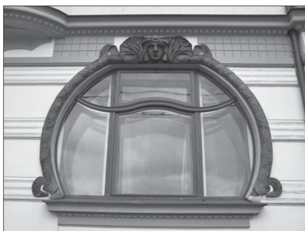
Sudová okna z roku 1908

Kloučkova vila charakterizuje využití secese jako výtvarného slohu usilujícího o vyjádření zdobné dokonalosti a přepychu bohaté elity žijící v Nové Pace na začátku 20. století. Odklání se od eklektických slohů historizujících fasád a s vložením vlastní výtvarné invence používá zdobné prvky pocházející z přírody a přímé linie a ostré hrany doplňuje vlnami, oblými stvoly a girlandami listů s jablky.