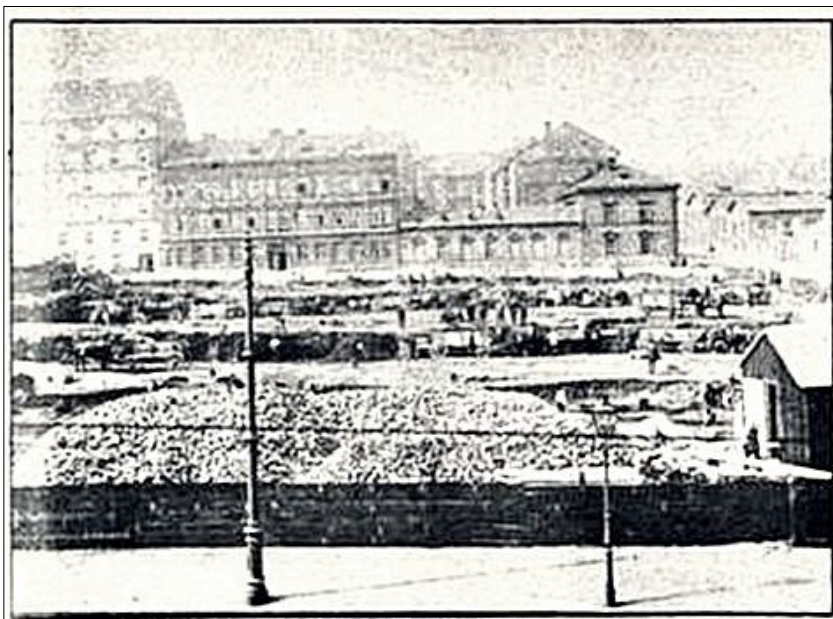
Už se stává velký veletržní palác v Praze. Přinášíme několik částečných pohledů na přípravu staveniště prvního paláce, který na ploše 9.000 m 2 bude vystaven

Veletržní palác, jedinečný příklad meziválečné funkcionalistické architektury, byl postaven podle návrhu Josefa Fuchse a Oldřicha tyla pro společnost Pražských vzorkových veletrhů mezi roky 1925 až 1928. Ve své době udivil rozlehlostí a koncepcí i racionálním pojetím. Palác s osmi nadzemními a dvěma podzemními podlažími nabídl výstavní sály a kinosál, v nejvyšším patře pak byly kavárna a restaurace s výhledem na Prahu. Podobu stavby ocenil i guru funkcionalismu, architekt Le Corbusier při své návštěvě Prahy v roce 1928. Od konce 40. let pak začal význam paláce jako místa pořádání veletrhů upadat. Stavbu postupně obsadili úředníci a obchodníci z podniků zahraničního obchodu. Nyní se dlouhá léta hovoří o rekonstrukci paláce, který slouží i jako depozitář galerie. Loni ale ministr kultury Martin Baxa řekl, že nyní nemá smysl investovat větší sumy do Veletržního paláce, protože jeho