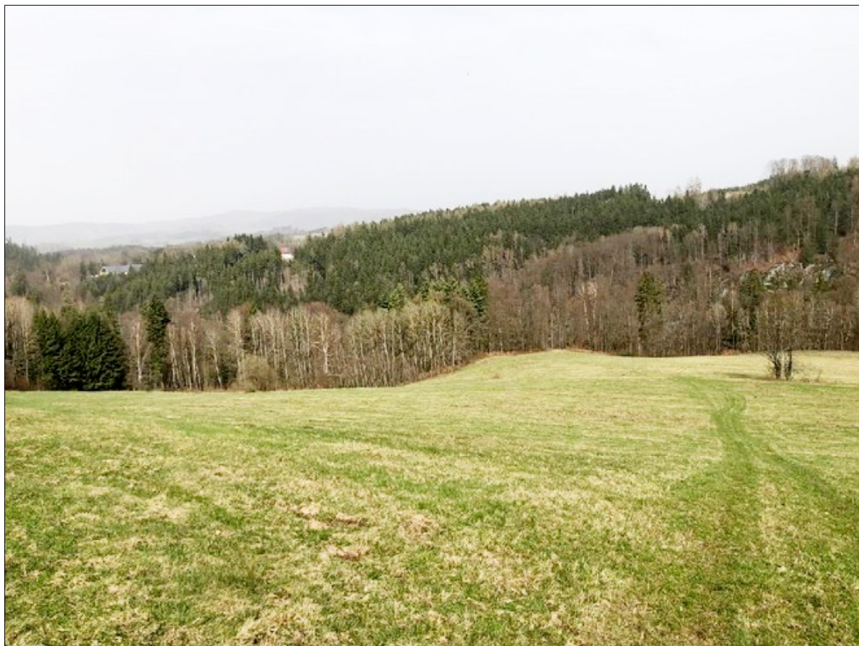
Z výletu z Plavů do Navarova