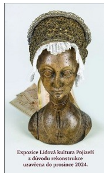
Expozice Lidová kultura Pojizeří z důvodu rekonstrukce uzavřena do prosince 2024.

Inscenace je v této sezóně uváděna u příležitosti jejího 50. výročí od premiéry.