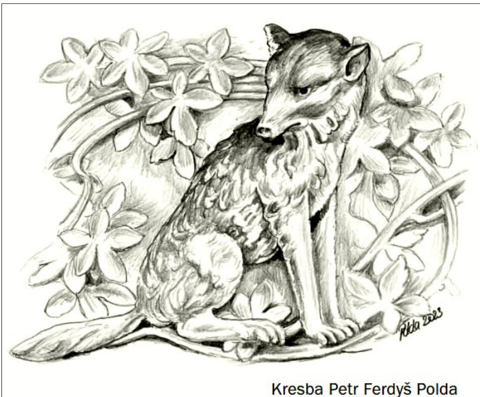
Kresba Petr Ferdyš Polda

Podnik Restaurace a jídelny zde našťestí za celou tu dobu upravoval pouze interiery, a tak mohla být krásná fasáda a ornamenty a figurami