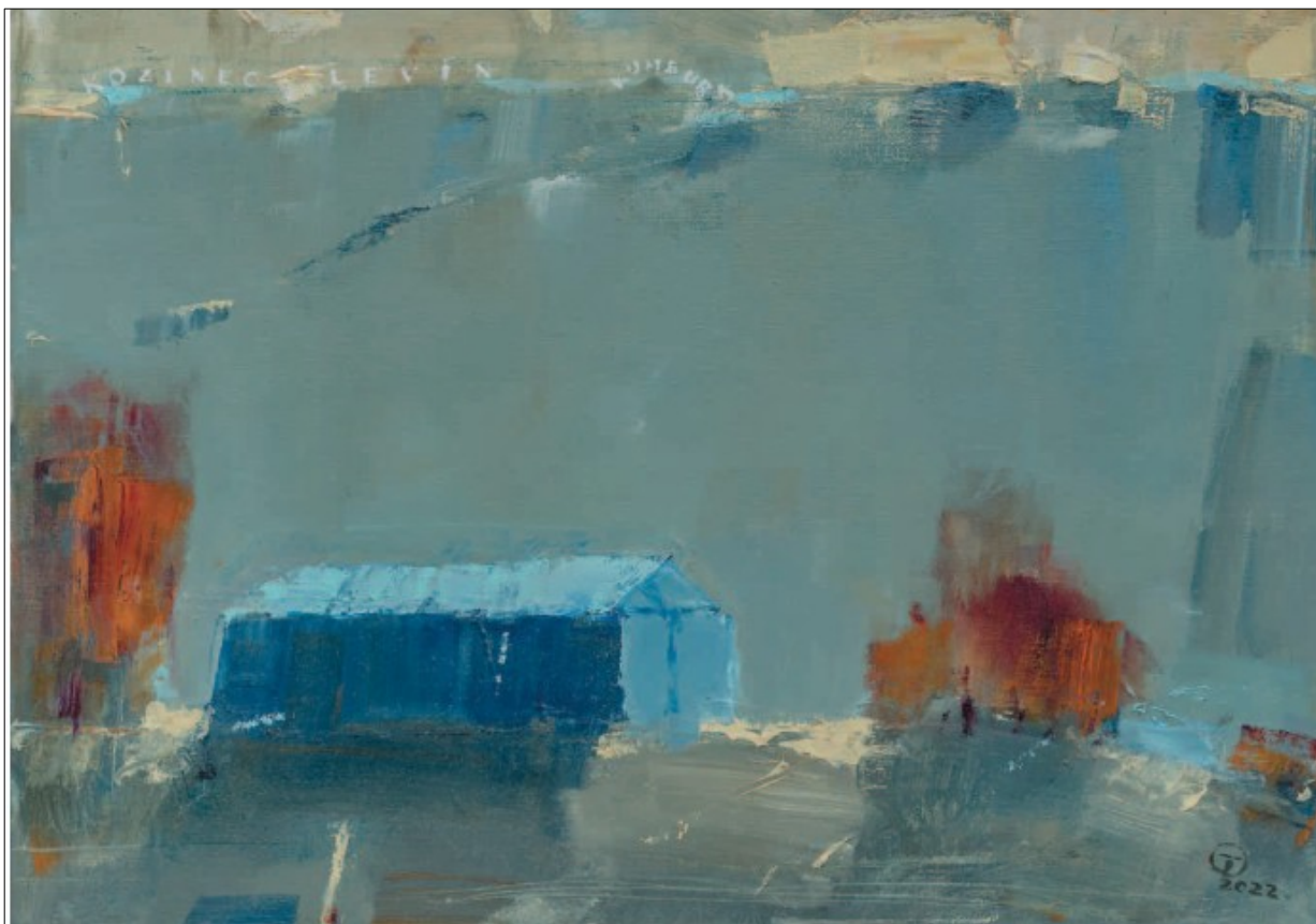
Modrá bouda v Pasekách nad Jizerou, olejomalba na plátně, 2022