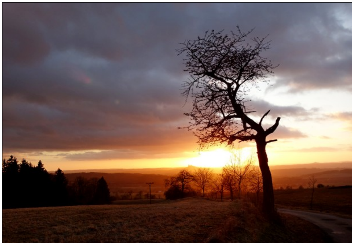
Motiv z Bezděčína