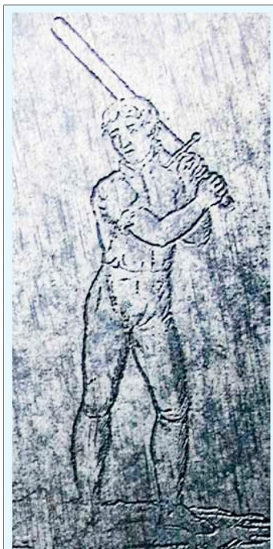
POSTAVA KATA vyrytá na čepeli boleslavského popravčího meče. Pravděpodobně jde přímo o podobiznu někoho z rodiny Růžičků.

Pro kříž kata Růžičky se vžil přídomek „smírčí“ a nejspíš mu i zůstane, byť není z pohledu historického trestního práva přesný. Zatím jedinou památkou, která definici smírčího kříže (tedy středověké kamenné památky tvaru kříže, vztyčené odsouzeným na místě spáchání závažného zločinu) opravdu splňuje, je nově objevený kříž v hlubokém údolí za městem. Na tomto místě se v dávné minulosti stala vražda nebo podobné neštěstí, které nám kříž se zatím nerozluštěnými nápisy připomíná. Odsouzený hříšník se vztyčením kříže kajicně usmiřuje s Bohem, dárce života. Je skutečně s podivem, že tato památka