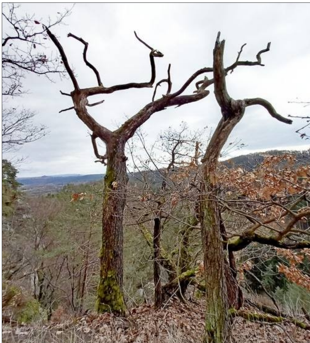
V Příhrazských skalách