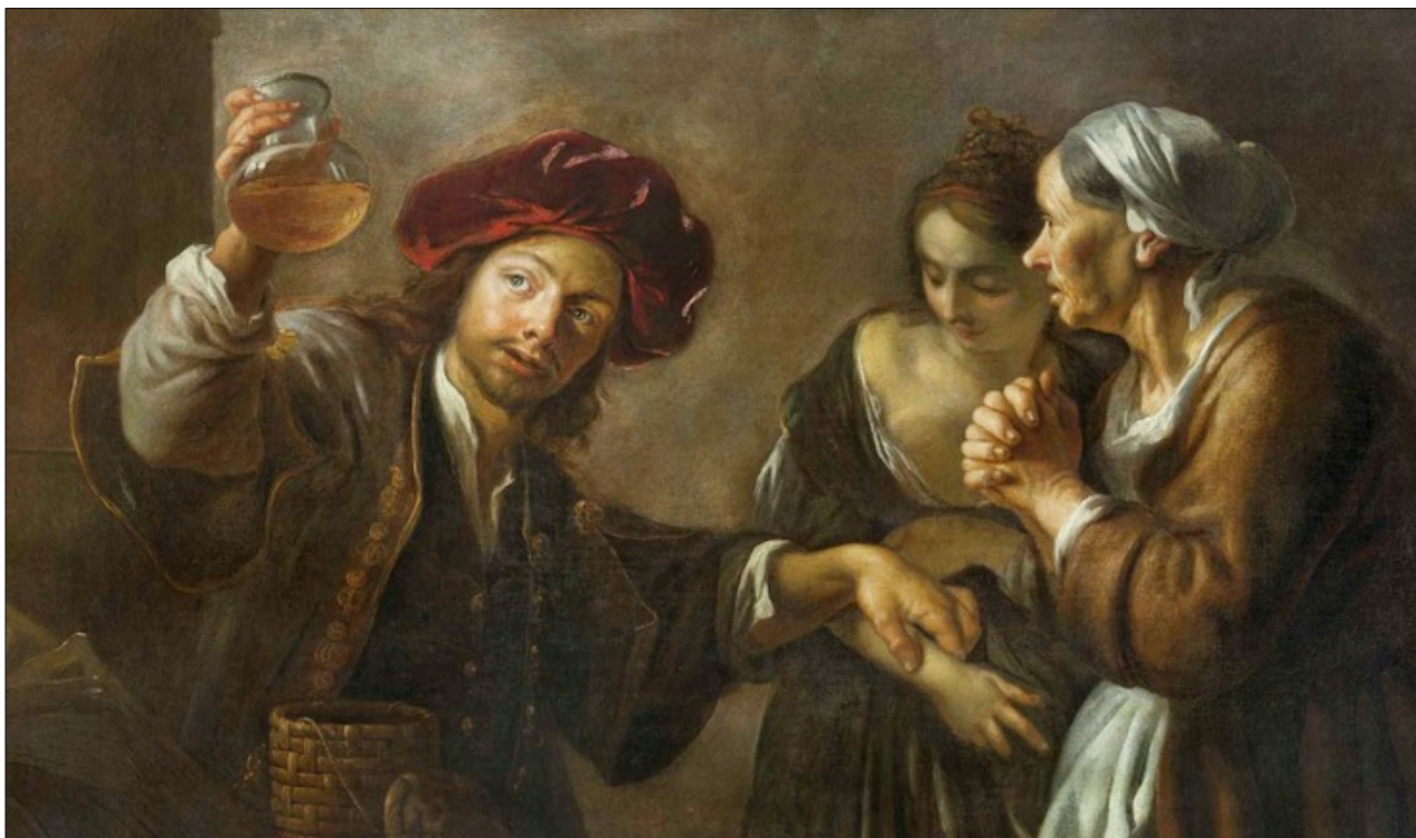
U felčara, 1719, z kláštera premonstrátů v Nové Říši

Výstava je koncipována jako vyprávění dvou paralelních příběhů: děl malíře a jeho života. Právě umělcův život, k němuž máme četné archivní doklady, je i pro dnešního diváka pozoruhodný nejen bohémským a revoltujícím způsobem, ale lze v něm najít zajímavé kontexty s problémy dnešní doby – Brandl byl celoživotním dlužníkem, neboť se zhlédl v životním stylu šlechty a luxusu, který si chtěl také dopřát. Dluhy jej však několikrát dostaly do vězení. I z toho důvodu se mu nevyhnuły soudní spory o výživné s manželkou. Problémy měl Brandl také s objednavateli děl, neboť často nedodržel smluvní podmínky.