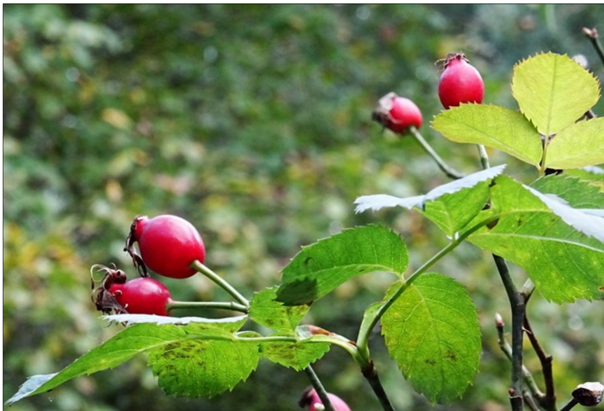
Motiv ze zahrady