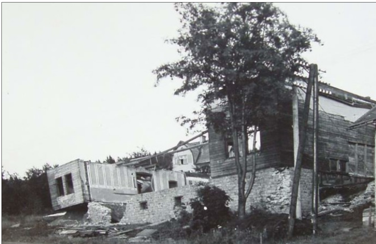
Loužnice, bourání staré sokolovny.