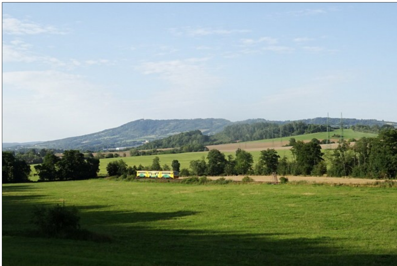
Vláček z Rovenska vjíždí do Hradeckého kraje