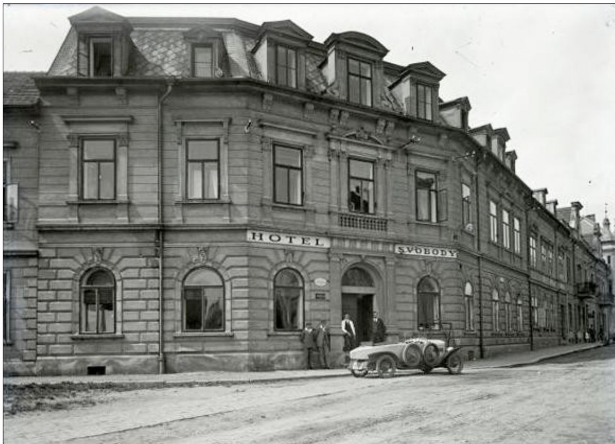
Turnov, hotel Svoboda, kolem 1930. Z webu města Turnov